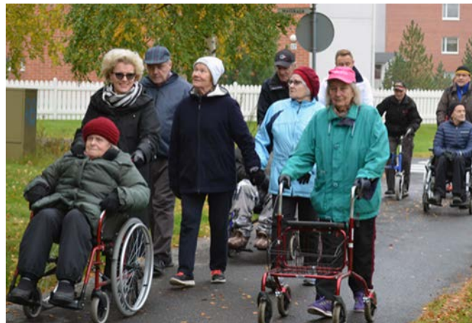
Palveluvaliokunta ja kotipalvelun henkilöstö ulkoiluttamassa "Vie vanhus ulos" –päivänä 27.9.2017

Vanhuspalvelulain tavoitteena on lisätä yksilöllisiä mahdollisuuksia vaikuttaa palvelujen kehittämiseen kunnassa. Tällä hetkellä Kempeleen kunnassa apuvälineinä on turvapuhelimia ja oivihälyttimiä, lisäksi vapaan liikkumisen paikantamisia.