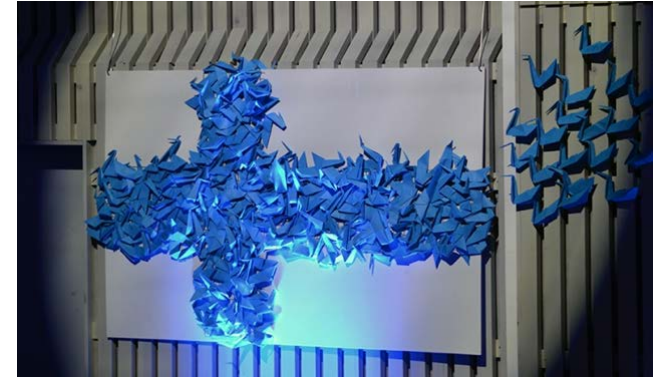
100-vuotisen itsenäisyysjuhlan koristelua 9. luokkien juhlassa.

Painopisteinä tilikaudella 2017 olivat sosiaalinen turvallisuus ja ikähoiva.